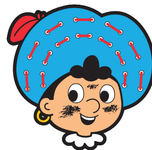
kleine boog afgewerkt