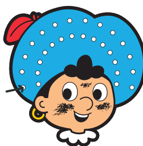
start grote boog

Als de grote gaatjesboog is afgewerkt rijg je ook op dezelfde manier het touw door de kleine gaatjesboog. Waauw wat ziet de pietenmuts er mooi uit!!