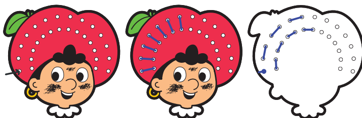
start gaatjesboog voorkant spelbord achterkant spelbord

Stop het touw (kant zonder knoop/touwstopper) langs onder (witte kant spelbord) door het eerste gaatje van de grote gaatjesboog. Trek het touw er volledig door tot het strak zit.