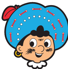
start kleine boog