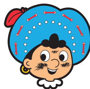
grote boog afgewerkt